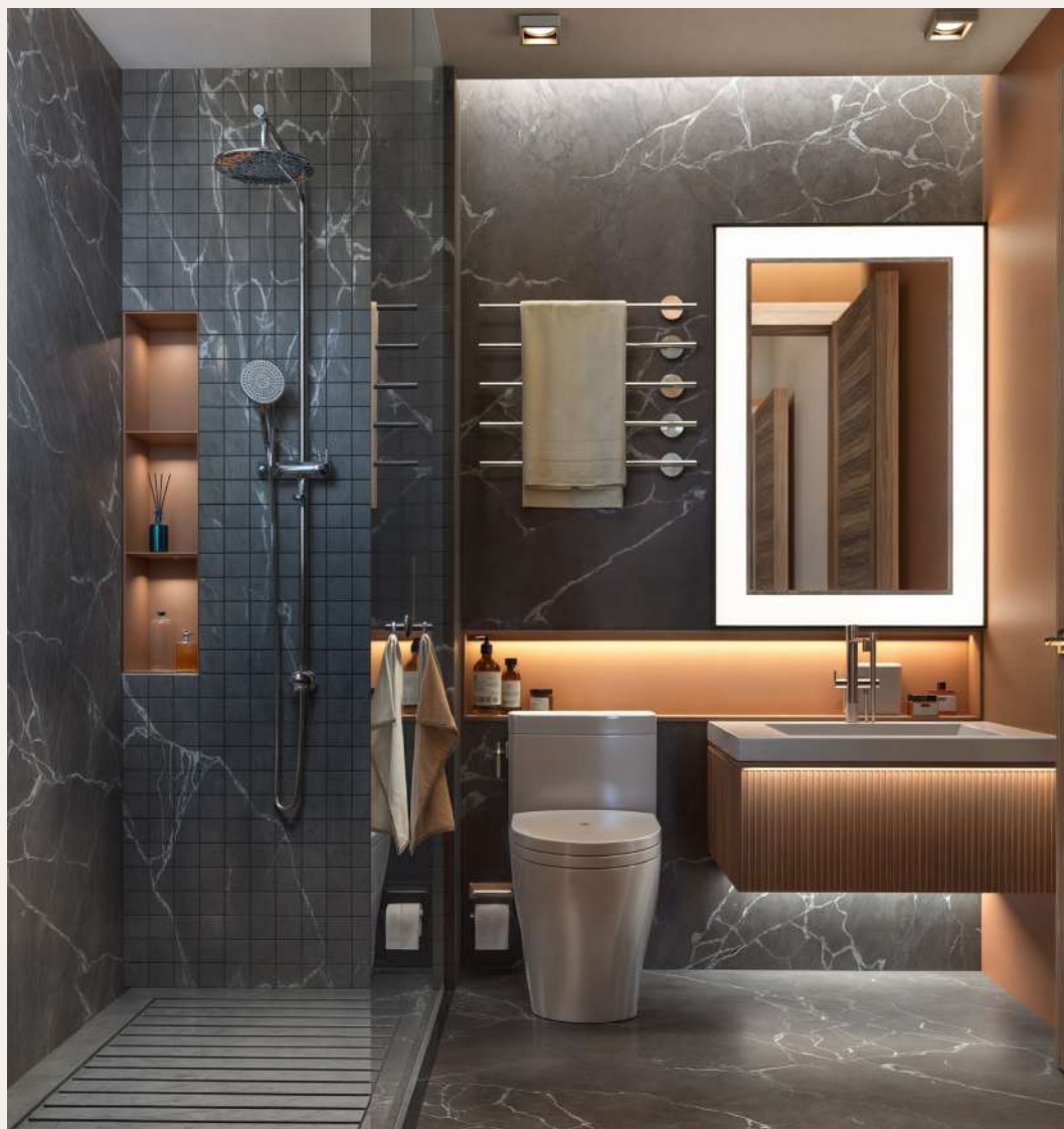
Baño de habitaciones