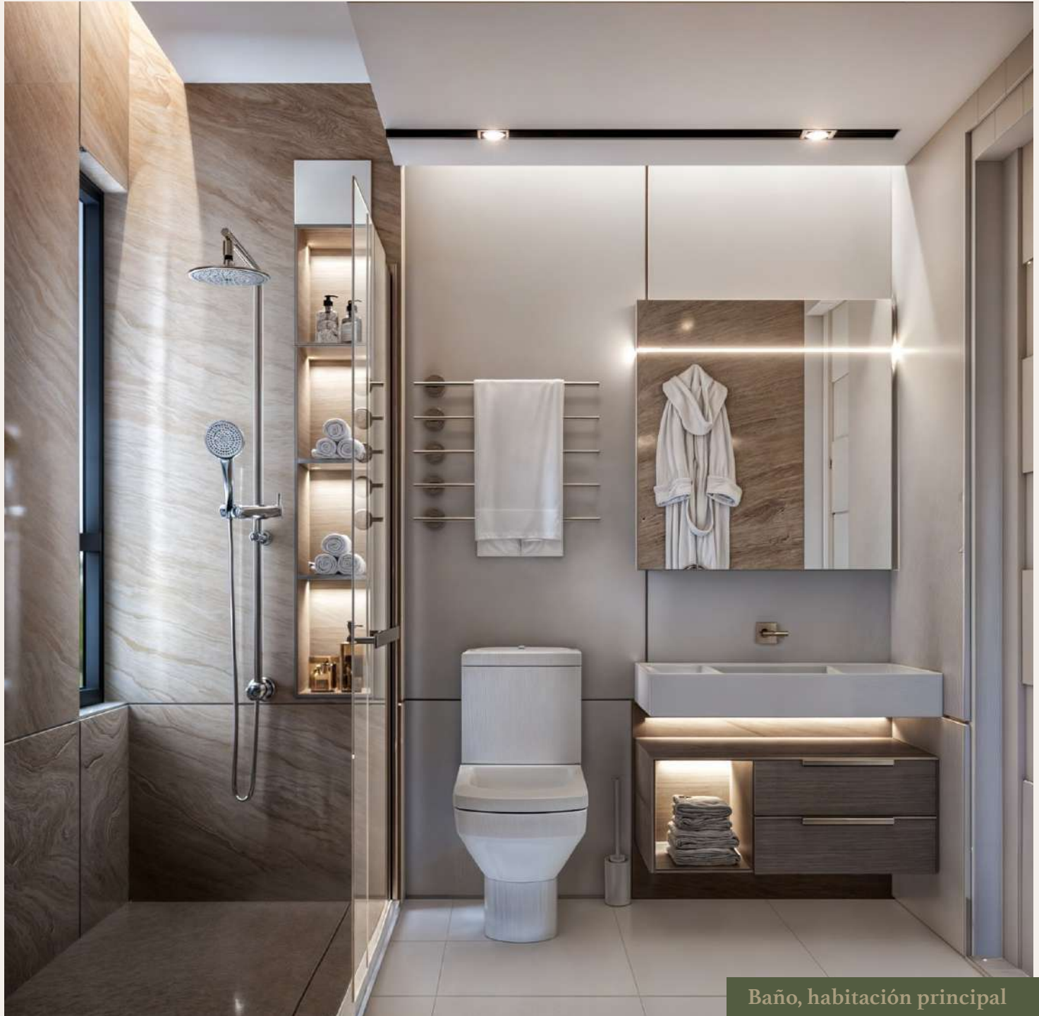
Baño, habitación principal