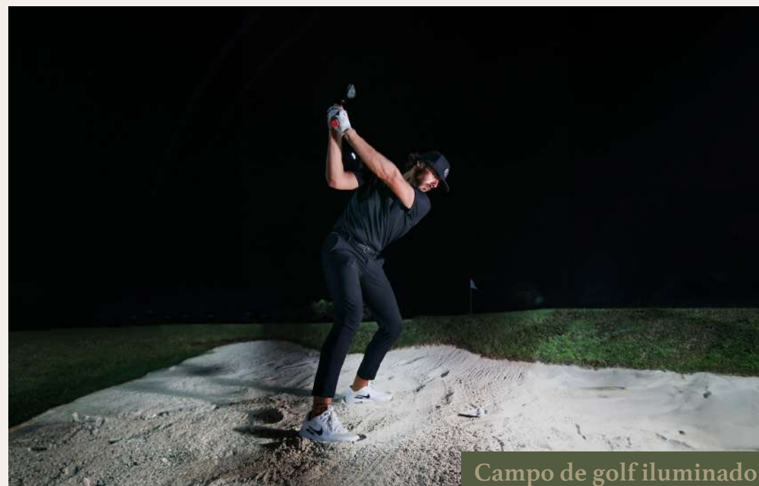
Campo de golf iluminado