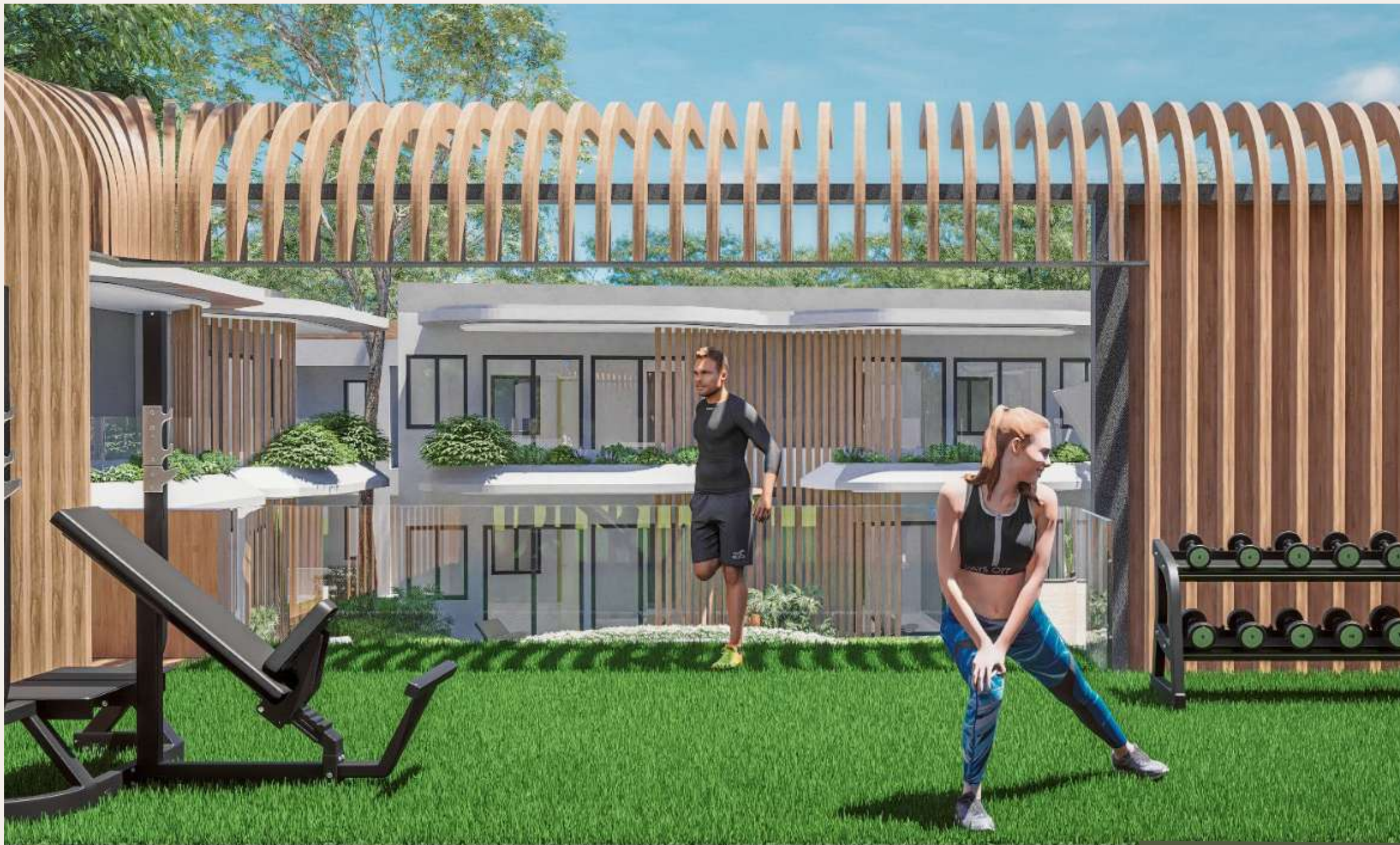
Gimnasio al aire libre