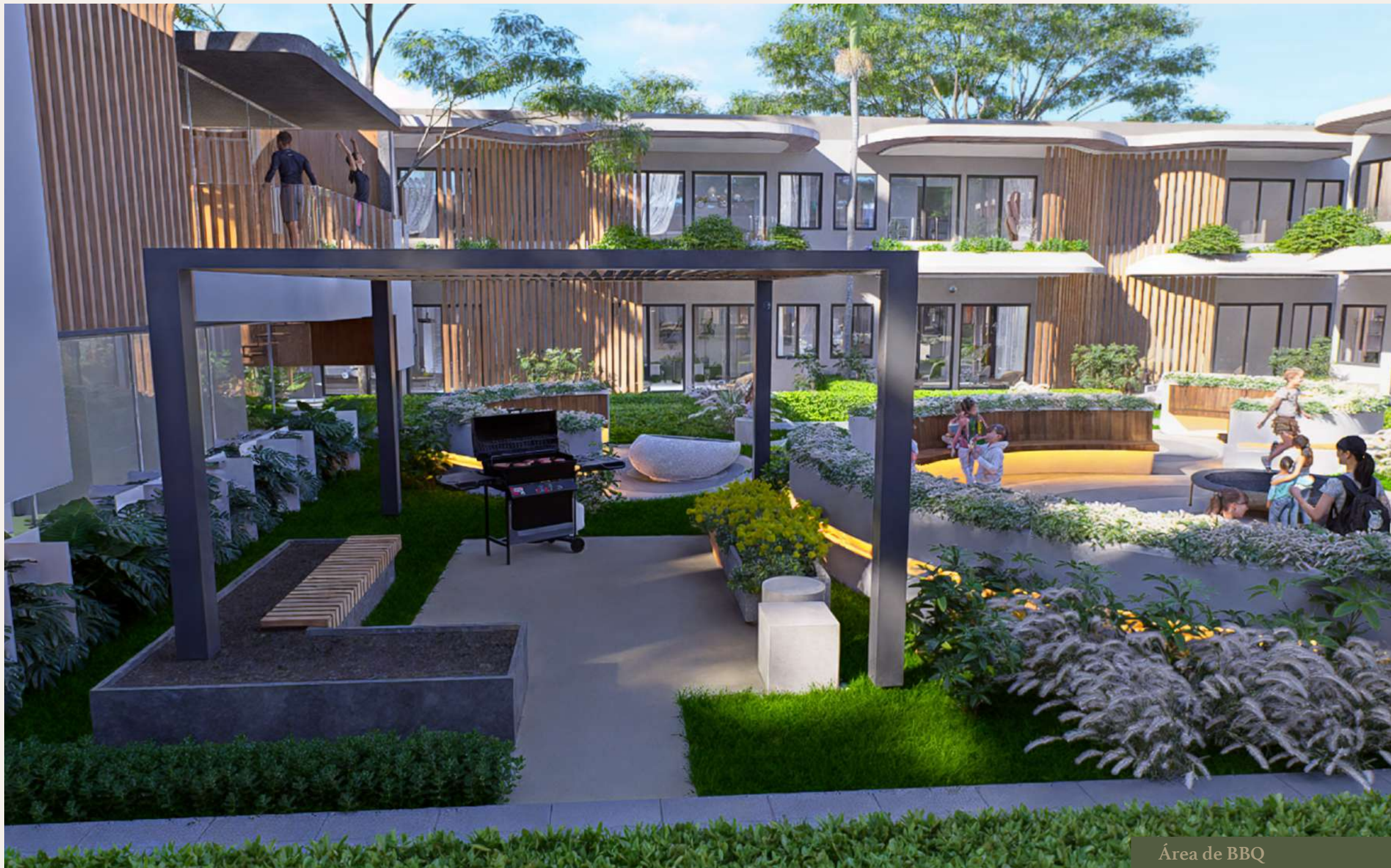
Área de BBQ